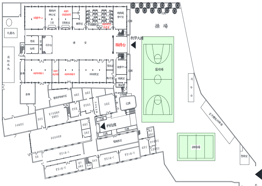
豫章工商一樓平面配置圖