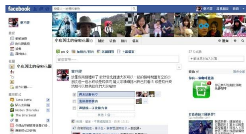
圖 1 FB 秘密社團--小鹿斑比的秘密花園