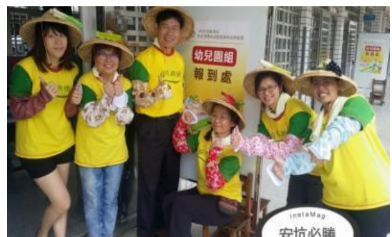
104年度教育部教學卓越比賽

新北市 2013 年度幼教之光特色幼兒園特優 新北市 104 年度教學卓越特優 教育部 104 年度教學卓越佳作 新北市 2016 年度幼教之光特色幼兒園優等 屢獲肯定是教學最大績效