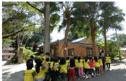
探訪校園內百年宿舍旁的老樹