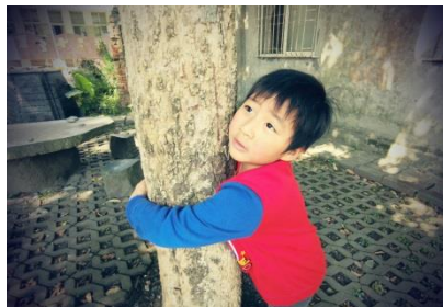
「手牽手」圍住大樹、「抱」住樹，數看看有幾個人抱著