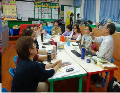
教師共組學習社群