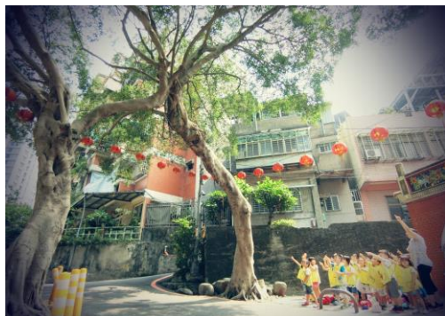
拜訪社區中的夫妻樹