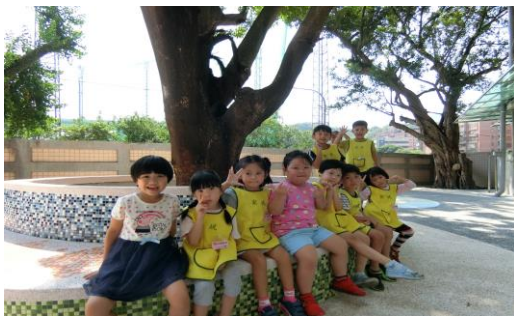
探索校園內重見光明的樹群