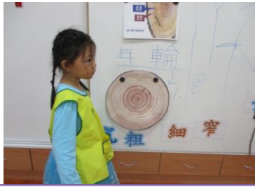
孩子們仔細地觀察著年輪的數目