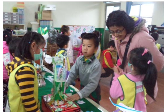
與家長分享學習成果