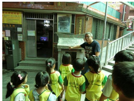
里長述說著夫妻樹與土地公廟的歷史