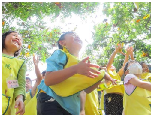
體驗自然探索樂趣

推展在地認同 ：結合方案所學，深化親師生在地認同，幼兒也可以是在地文化的詮釋者，成為文化傳播的種子，在每個家庭中萌芽。