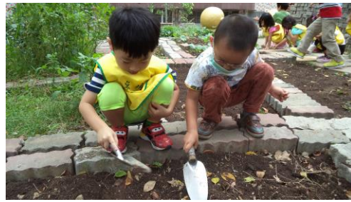
課程落實於生活中